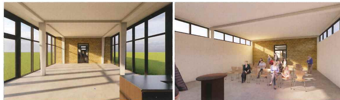
Illustration: temak projektmanagement- und projektsteuerungs-gmbh

Weitere Details finden Sie auf www.buergerverein-trier-heiligkreuz.de unter Aktuell